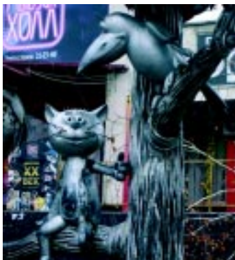
В Воронеже даже мультяшному коту есть памятник!

В этот же день студии соревновались в своих знаниях по журналистике. Для этого организаторы устроили два