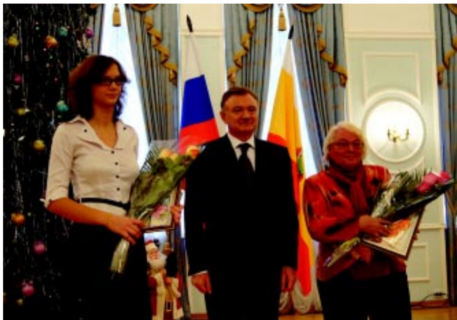
На снимке: церемония награждения.

Уже не первый год губернаторской стипендией отмечаются талантливые питомцы литературного объединения