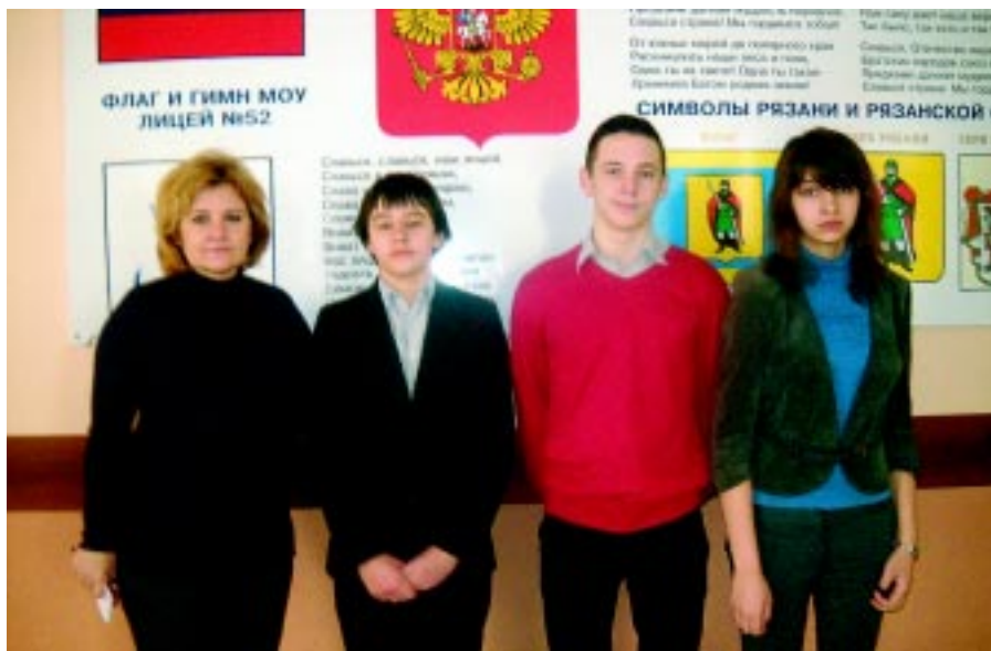
На фото: авторы книги и руководитель проекта.

Книга оформлена прорезной резьбой. Это очень большой труд. Сначала на фанере рисовались отдельные буквы, потом лобзиком приходилось вырезать каждую из них. Текст переводили на лист через копировальную бумагу, ну а потом был долгий процесс выжигания. Текст написан пером и тушью на старых акварельных листах. Писали настоящим пером. Очень сложно было. Сшивали книгу на уроках труда, лентой в виде российского триколора (флага). Использовали много клея, с которым детям нельзя было работать. Помогали взрослые.