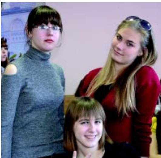
На фото: участники фестиваля «Начало»